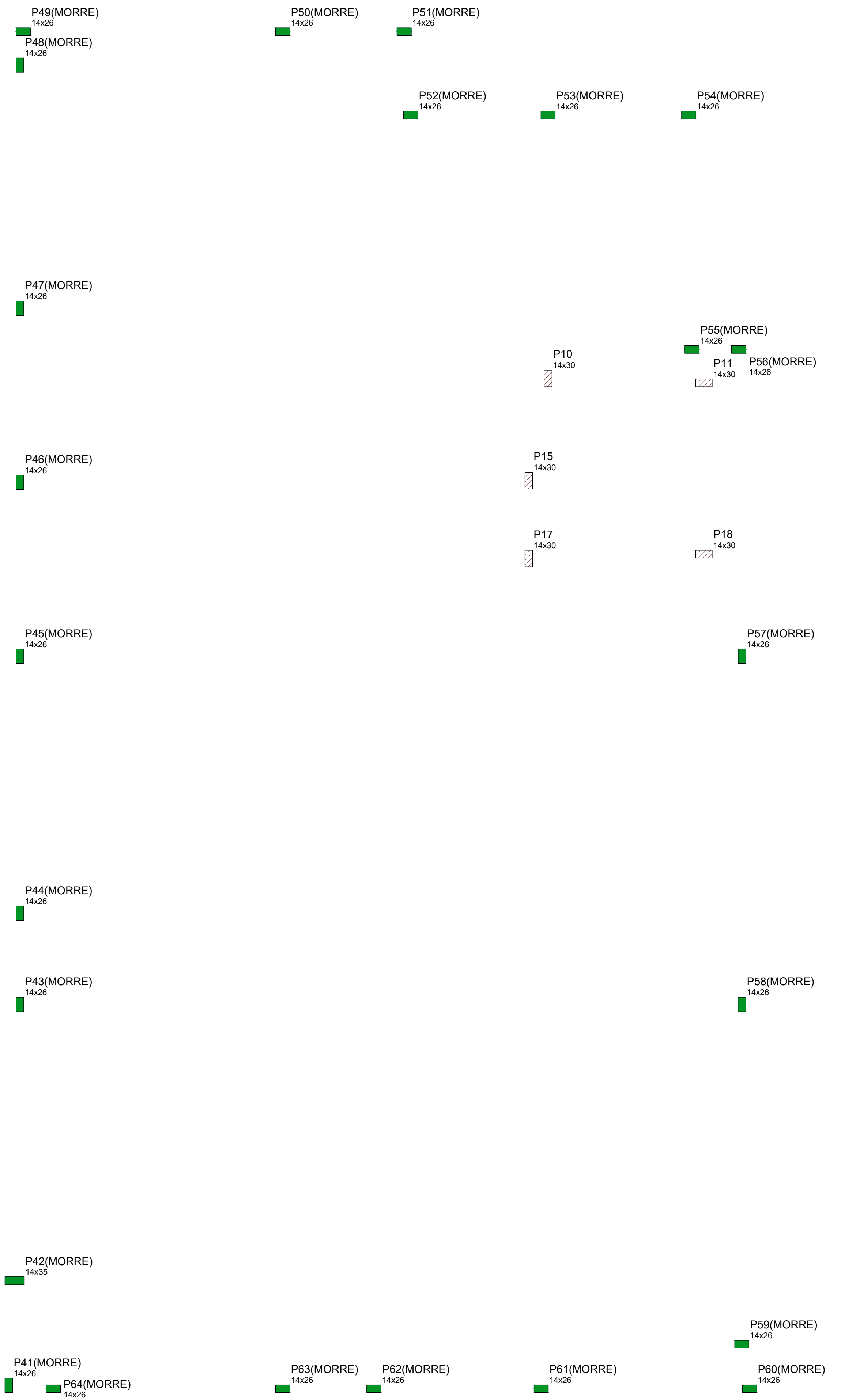
Forma intermediária do pavimento Cobertura (Nível 398)